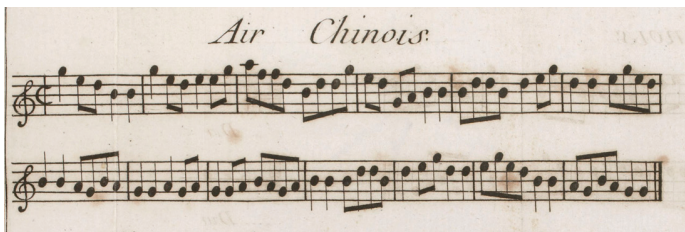
Chinesische Melodie aus Jean-Jacques Rousseaus „Dictionnaire de musique“ (1768), die Weber in seiner Musik zu „Turandot“ verwendete.